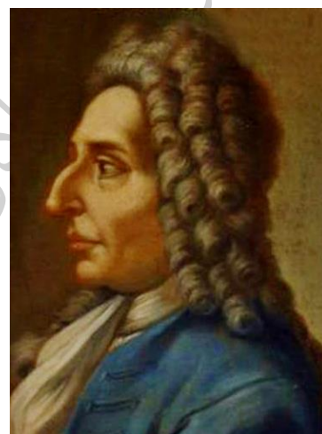
جیووانی باتیستا ویتالی

در همین دوران تمایل مهم دیگری در تثبیت شماره موومان‌های سه‌گانه بروز می کند. کورلی با در پیش گرفتن رویه پنج موومانی در دو بخش مجزا به هواداران موومان‌های سه‌تایی که از اوورتور ایتالیایی ۱۴ و سمفونیا ۱۵ اقتباس شده است، نمی‌پیوندد. او با ارائه گراو ۱۶ ، آلگرو ۱۷ ، ویواچه ۱۸ ، لارگو ۱۹ و آلگرو راه دیگری در پیش می‌گیرد، اما ویوالدی با پذیرفتن ضمنی ترکیب سه بخشی، بارها و بارها به این فرم بازگشت می‌کند و در عین حال با حذف تکرار موومان‌های تند به آن یکدستی، اتحاد و سازگاری لازم را ارزانی می‌دارد. در اوایل قرن هجدهم آهنگ‌سازان پی‌شرو قدم‌هایی در جهت استفاده نکردن از باس کانتینو بر می‌دارند که این امر مستلزم افزایش رنگ‌آمیزی و تمبر سازها نیز هست. حرکتی که در نهایت به استقلال آن‌ها می‌انجامد. این دگراندیشی، گستره کنسرتو گرو سو تا سنفونی