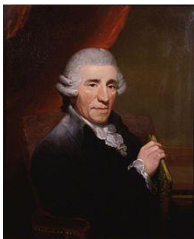
فرانز جوزف هایدن

بیست سال پایانی قرن هفده و بیشترین سال‌های سده هجدهم دوران ارتقای مقام موسیقایی ایتالیا به‌شمار می‌روند. در این سال‌ها فرانسه از تکنیک موسیقی ایتالیا الهام می‌گیرد و آشکارا قدم‌های مؤثری برای سهیم شدن در ساختار فنی موسیقی اروپایی بر می‌دارد. این توسعه و گسترش در موسیقی آهنگسازان آلمانی به وحدت نظر کلی رسیده و به بار می‌نشیند. در همین دوران ایتالیایی‌ها در پی اثبات وسعت و امکانات ساز و فرم‌های موسیقی همچنین اپرای خود، با سخت‌گیری‌های ناروا، بالندگی و صعود موسیقی را دچار وقفه و رکورد کرده و به سرایشی سوق می‌دهند. ایتالیا با نپذیرفتن نظریه‌های تازه و راه ندادن آن‌ها به موسیقی، ایده‌ها و اصول را چه از دیدگاه فرم و چه از نظر بیان و تکنیک، عقیم ساخته و پذیرش آن‌ها را از غیر خودی مردود و مطرود می‌نامد. با این همه، استعداد و خلاقیت سرشار آهنگسازان آن دیار چنان شهرت برجسته و عظیمی برای آن‌ها به بار می‌آورد که در کمتر ملتی نمونه آن را می‌توان یافت. خودبینی ایتالیایی و سخت‌گیری‌های بی‌هوده از سویی و ظهور قهرمانان و متفکران با ذوق از سوی دیگر فرمانروایی ایتالیای برتر را دچار تزلزل کرده و به ناچار حیطه‌های به ظاهر دست نخورده موسیقی از طریق اسلوب و استیل‌های جدید مورد تهاجم قرار می‌گیرد. فرانس جوزف هایدن ۱ و ولفگانگ آمادئوس موزار ۲ با درایتی خاص و سیاستی حساب شده، رسوم و اعتقادات پیشینیان خود را که بوی کهنگی و ماندگی شان م‌شام را می‌آورد، کنار گذاشته و با سرپیچی از قوانین کهنه و فرتوت، فرم‌ها و راه‌های بیان جدیدی را به عرصه‌های موسیقی وارد می‌کنند. آن‌ها با هوشیاری فراوان راه را بر اندیشمندان و مصنفان خلاق قرن نوزدهم باز کرده و بدعت تازه‌ای علیه کهنگی‌ها