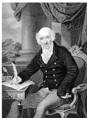
جیووانی باتیستا ویوتی