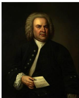
یوهان سباستیان باخ

و عقیم بودن آیین‌های کهن موسیقی ایتالیایی آغاز می‌کند. این تحولات درست زمانی اتفاق می‌افتد که موسیقی ایتالیا تمام اروپا را به فرمان خود درآورده است. در نیمهٔ دوم قرن هفدهم استیل سازی مکتب ایتالیا به سرعت رو به توسعه و گسترش می‌نهد. آهنگسازان سازهای کلاویه‌دار، استیل ارگ و هارپسیکورد را به طور مجزا به کار گرفته و در عین حال آثاری برای ساز ویلن تصنیف می‌کنند. ماهرانه‌ترین و اولین فرم به جای مانده از آن دوران اثری مربوط به اواسط قرن هفدهم است که تریوسونات ۳ نام دارد. این فرم الگوی آثار بعدی موسیقی مجلسی می‌شود و به عنوان یک موومان در سمفونی جای می‌گیرد.