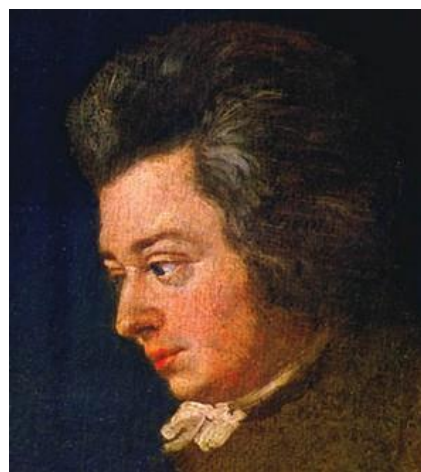
ولفگانگ آمادئوس موزار