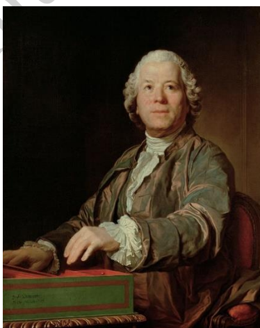
کریستف ویلی بالد گلوک