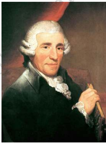
فرانس ژوزف هایدن