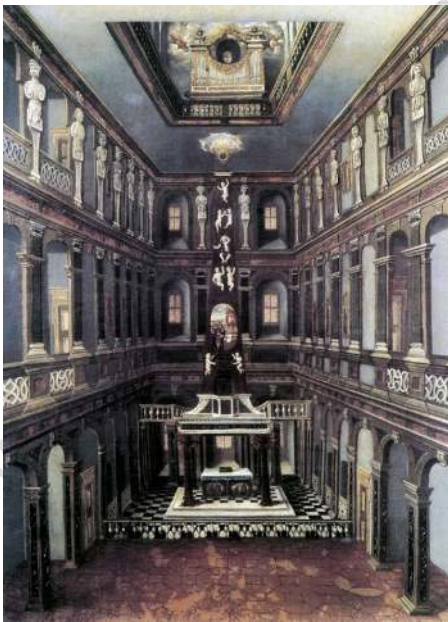
کلیسای کاخ سلطنتی در وایمار جایی که باخ در آن بعنوان ارگ‌نواز سلطنتی می‌نواخت

هدف عمده و اساسی طرز بیان موسیقایی در آیین لوتری و یکی از جاهای به کارگیری کر، کانتات مذهبی بود. کانتاتا جهت ارائه یک قطعه آوازی در مقابل سوناتا که برای بیان سازی موسیقی بکار می‌رفت، قرار داشت. در روزگار باخ کبیر انواع بسیاری از کانتاتاها مرسوم بود و مصنفان در تمام آن‌ها به آفرینش دست می‌زدند. اما هدف اساسی در این بخش متمرکز شدن بر روی طرح کانتاتا برای آیین لوتری در آلمان اوایل قرن هجدهم است.