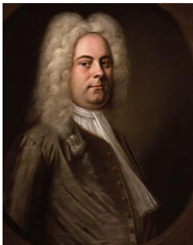
ژرژ فردریک هندل

وراتوریو با دارا بودن یک توالی و ردیف پی‌درپی کر، آریاها، دوئت‌ها، رستیتایف‌ها، و اینترلودهای مشخص ارکستری، فرمی محکم و ویژه به حساب می‌آید. نقش‌گر در این فرم بسیار مهم به نظر می‌رسد و توجیه و تفسیرها از سوی موسیقی، در سهیم شدن با درام ارزشمند است. رستاتیف‌ها معمولاً در نقش راوی ضمن شرح داستان، ارتباط یک قسمت را با قسمت‌های دیگر برقرار می‌کنند و گاه چندین قطعه را به دنبال هم می‌سرایند. اجرای بعضی از اوراتوریوها به زمانی بیشتر از دو ساعت نیازمند است که با توجه به طولانی بودن این فرم نسبت به کانتات، چنین چیزی دور از انتظار نیست.