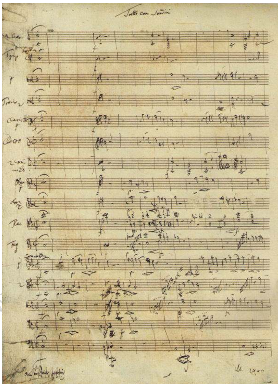
بخشی از دسته‌نوشته فرانس ژوزف هایدن، اوراتوریوی "آفرینش"

راه پیدا کرد و در طی این مهاجرت تاریخی خود، بسیاری از فرم‌های عاریتی دیگر را بر خود پذیرفت. از مشهورترین اوراتوریوهای جهان، اوراتوریوی کریسمس ۱۲ اثر باخ کبیر، اوراتوریوی آفرینش ۱۳ کار فرانس ژوزف هایدن ۱۴ و داود شاه ۱۵ از آرتور اونه‌گر ۱۶ را می‌توان نام برد.